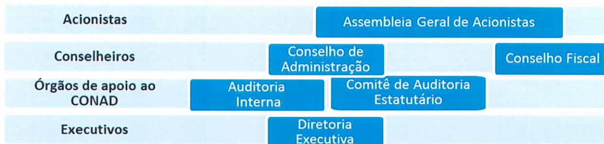
Figura 1 – Governança Corporativa

A Governança Corporativa da ALGÁS é estruturada com os seguintes colegiados: a Assembleia Geral de Acionistas, com três membros indicados por cada um dos acionistas; Conselho de Administração instalado com oito membros, sendo quatro indicados pelo acionista Estado de Alagoas, um indicado pelo acionista GASPETRO, um indicado pelo acionista MGEB, um indicado conjuntamente pelos dois acionistas minoritários, GASPETRO e MGEB; um eleito pelos empregados como seu representante; Conselho Fiscal, com cinco membros titulares, sendo três indicados pelo acionista Estado de Alagoas, um indicado pelo acionista GASPETRO e um indicado pelo acionista MGEB; e a Diretoria Executiva, composta por três diretores indicados por cada uma dos acionistas, sendo o Diretor Presidente indicado pelo acionista Estado de Alagoas. A estrutura de governança também contempla dois órgãos de apoio ao Conselho de Administração: a Auditoria Interna e o Comitê de Auditoria Estatutário, este último composto por três membros indicados por cada um dos acionistas. Essa estrutura está em consonância com a Lei 13.303/2016 e é regida por normativos próprios da Companhia: estatuto, políticas e regimento interno. A Assembleia de Acionistas e o Conselho de Administração contam ainda com o suporte do Comitê Estatutário de Elegibilidade para a análise de elegibilidade dos membros indicados para a Diretoria Executiva, para o Comitê de Auditoria Estatutário, para o Conselho de Administração e Conselho Fiscal.